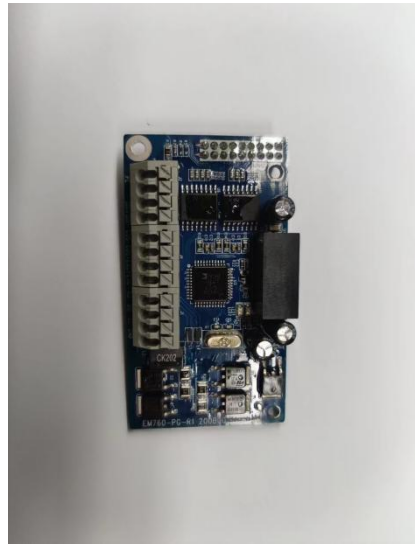
图附 2 PG 卡实物图